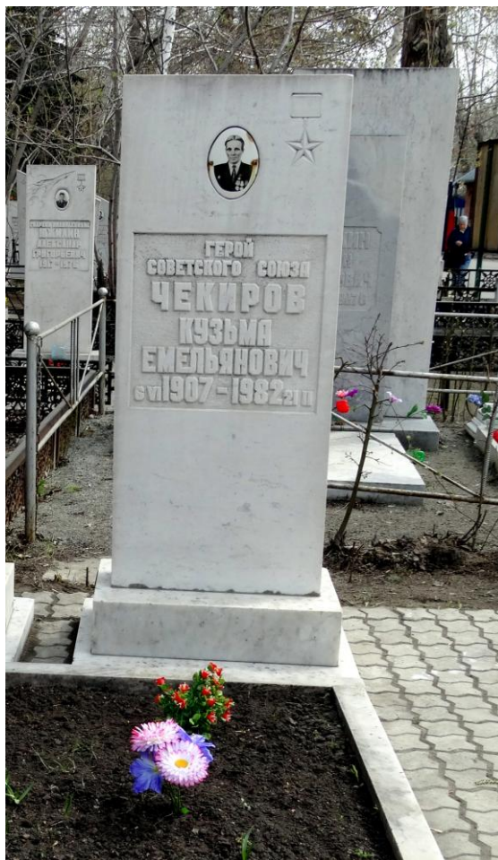
Май 2014 г.

Основание для учёта: список №2 от 11.11.1992 г.