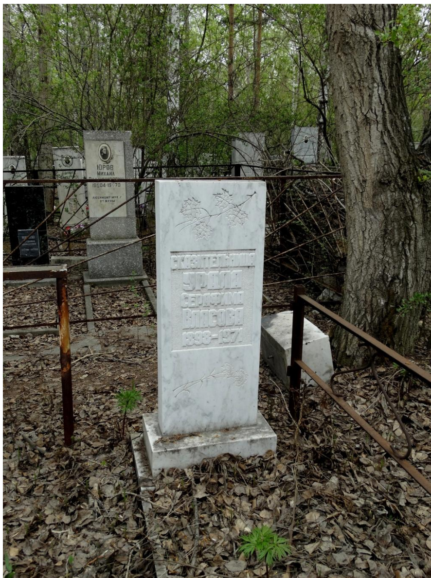
Май 2014 г.