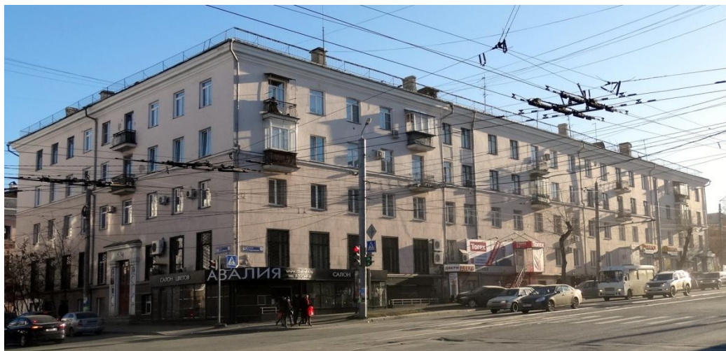
Ноябрь 2013 г.