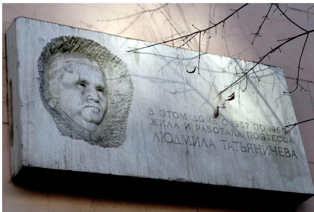
Январь 2013 г.

Мемориальная доска на доме по адресу С.Кривой, 39 установлена 19 декабря 1981 года. Автор барельефа – скульптор Авакян В.А.