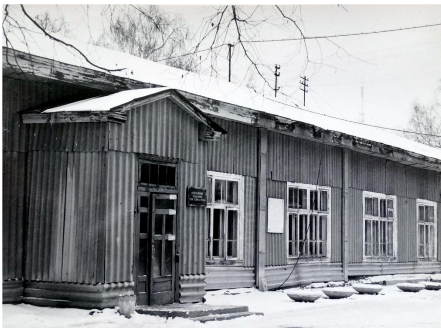
Ориентировочно 1977-1979 годы. Здание корпуса «Ухо, горло, нос» (ЛОР отделение).