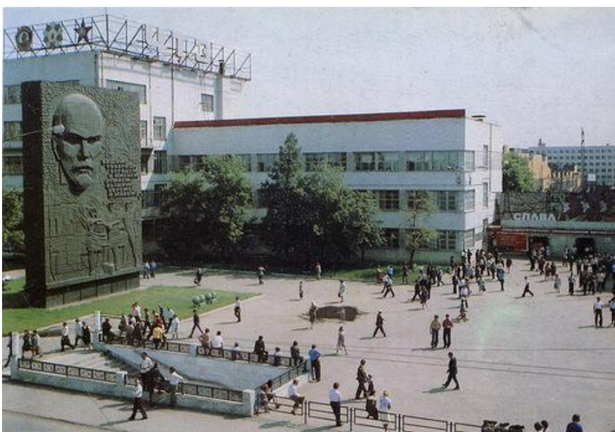
Из книги: Киреев А.Г., Ховив Е.Г. "ЧТЗ моя биография", Ч.: ЮУКИ, 1983