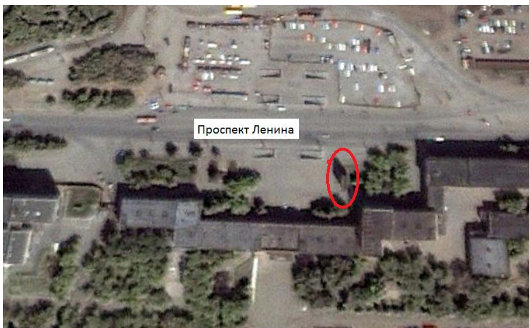
Пр. Ленина, 1, г. Челябинск. Спутниковый снимок 6 октября 2000 года

Монументальная стела (размером 10x15 м) в честь 100-летия со дня рождения Ленина В.И. была установлена около заводоуправления ЧТЗ в апреле 1970 г. Открытие стелы-монумента состоялось 22 апреля 1970 г. На западной стороне стелы был изображён барельеф лица Ленина и слова из стихотворения В. Маяковского. На противоположной стороне – развёрнутое Памятное знамя ЦК КПСС, Президиума Верховного Совета СССР, Совета Министров СССР и ВЦСПС, завоёванное в труде в честь 50-летия СССР.