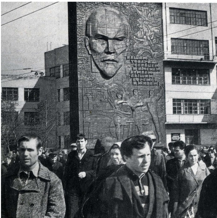
Фрагмент фотографии С. Васильева из книги «Урал в век Ленина», Ч., 1977

Основание для учёта: экспертиза ГНПЦ и список №3 от 25.04.2000 г.